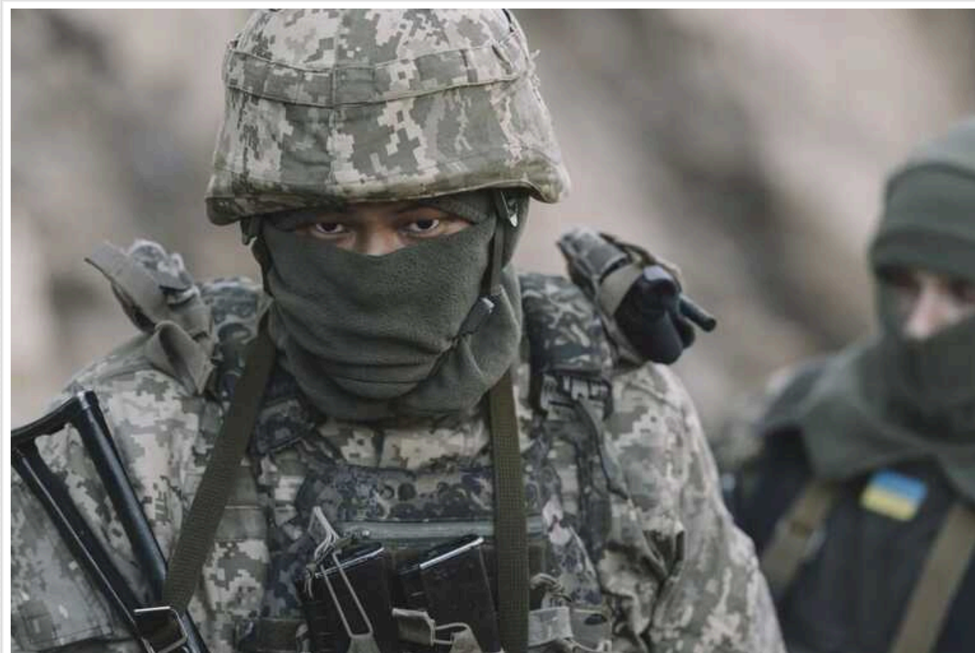
Російські добровольці заявили, що зайшли до ще одного населеного пункту Белгородської області

Російські добровольці заявили, що зайшли до населеного пункту Горьківський Белгородської області. Бійці захопили будівлю місцевої адміністрації.