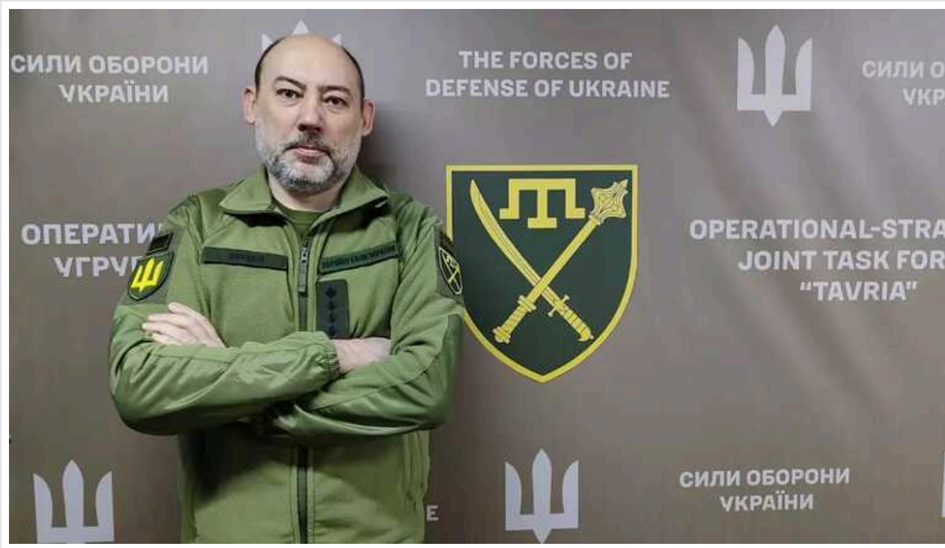
Дмитро Лиховій залишив посаду речника оперативно-стратегічного угруповання військ "Таврія"

Військовий повідомив про це на своїй сторінці у Facebook.