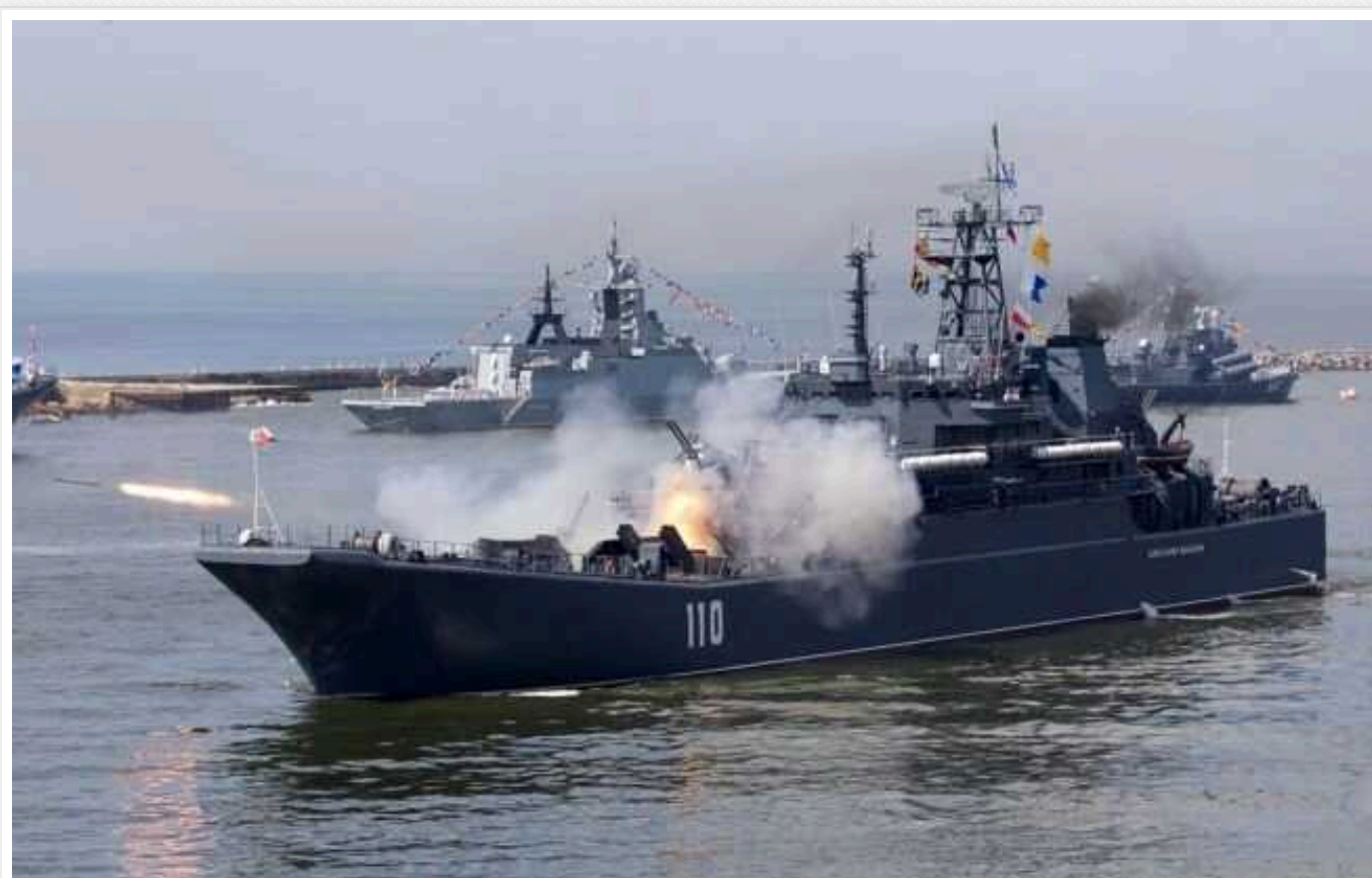
РФ вивела військові кораблі з Чорного й Азовського морів

Країна-агресор Росія не виводила бойові кораблі в Чорне та Азовське море. Водночас у Середземному вона тримає кілька носіїв ракет "Калібр".