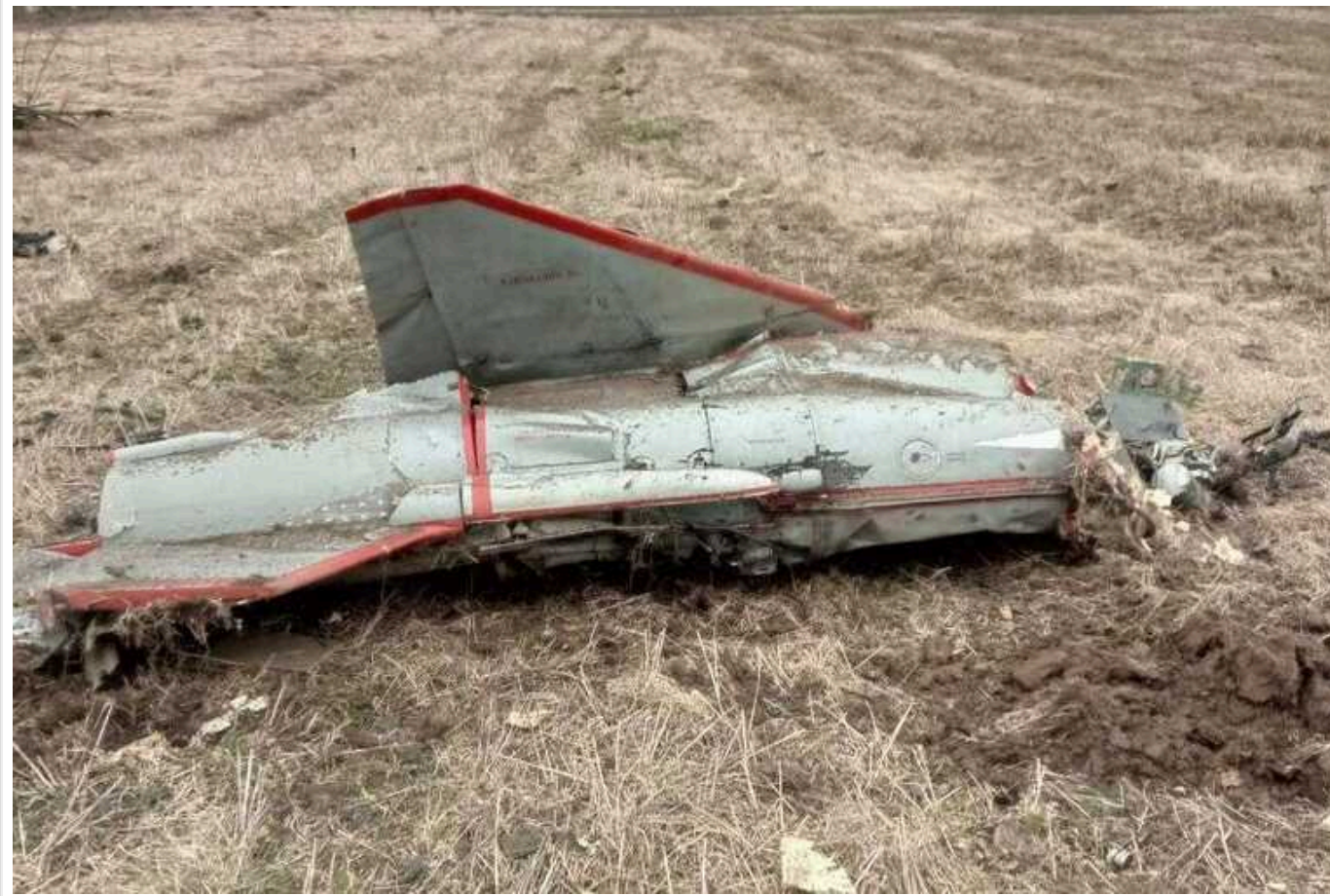
Forbes: українські семитонні ударні дрони Ту-141/143 знову в дії

Видання Forbes пише, що українські семитонні ударні дрони знову в дії.