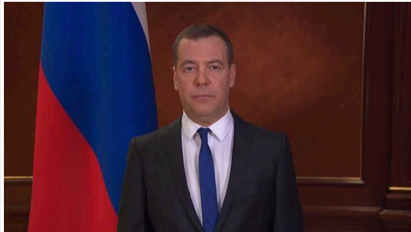
Медведєв назвав росіян, які псують бюлетені, "кримінальними активістами", і пригрозив статтею про держзраду

Заступник голови Ради безпеки РФ Дмитро Медведєв пригрозив росіянам, які "вчиняють злочини" на виборчих дільницях або поруч із ними під час виборів президента країни-агресора. До "злочинів" він відніс зокрема підпали та вандалізм – такі випадки вже були зафіксовані у різних регіонах Росії.