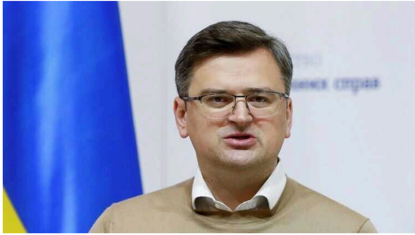
Кулеба провів телефонну розмову з Блінкеном: зійшлися на необхідності швидкого схвалення пакету допомоги

Міністр закордонних справ України Дмитро Кулеба 16 березня провів телефонні переговори з державним секретарем США Ентоні Блінкеном. Сторони підтримують необхідність оперативного голосування американською Палатою представників за додаткове фінансування військової допомоги Києву.