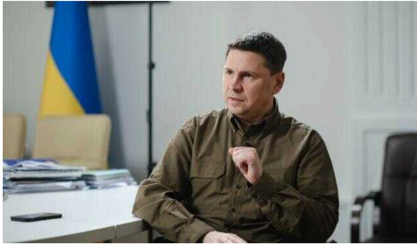
Подоляк спрогнозував зміну влади в РФ: "Буде некерований бунт, Путіна не знайдуть"

Михайло Подоляк висловився про російську опозицію та можливий переворот в Росії.