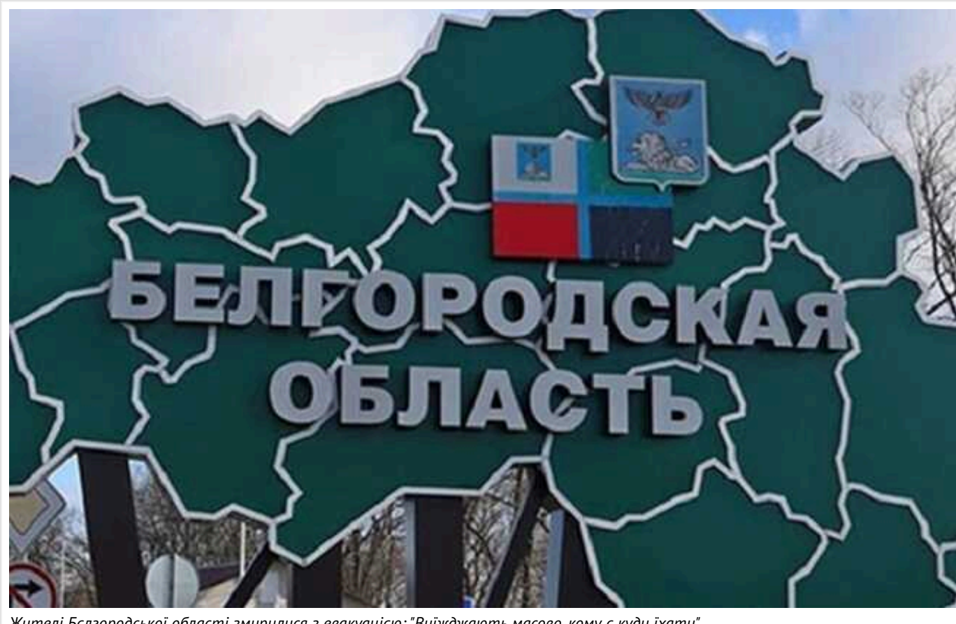
Жителі Белгородської області змирилися з евакуацією: "Виїжджають масово, кому є куди їхати"

Через бойові операції російських повстанців у Білгородській області з регіону масово виїжджають місцеві жителі. РФ стягує туди додаткову військову техніку. Люди у паніці й чекають на мобілізацію.