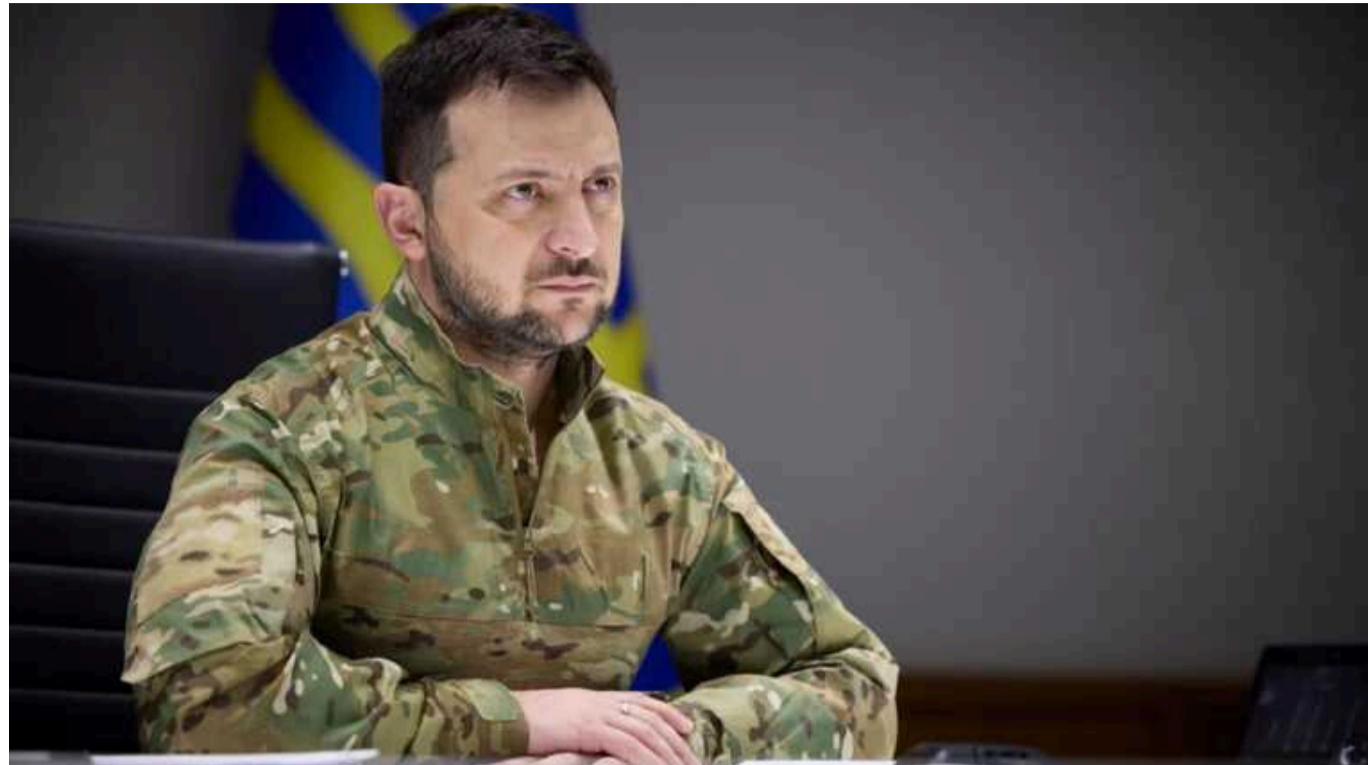
Зеленський подякував усім причетним до ударів по об'єктах російського ВПК: "Це українська далекобійність"

Президент Володимир Зеленський заявив, що Україна тепер завжди матиме свою власну ударну силу в повітрі. Він також подякував усім причетним до ударів по об'єктах російського військово-промислового комплексу (ВПК).