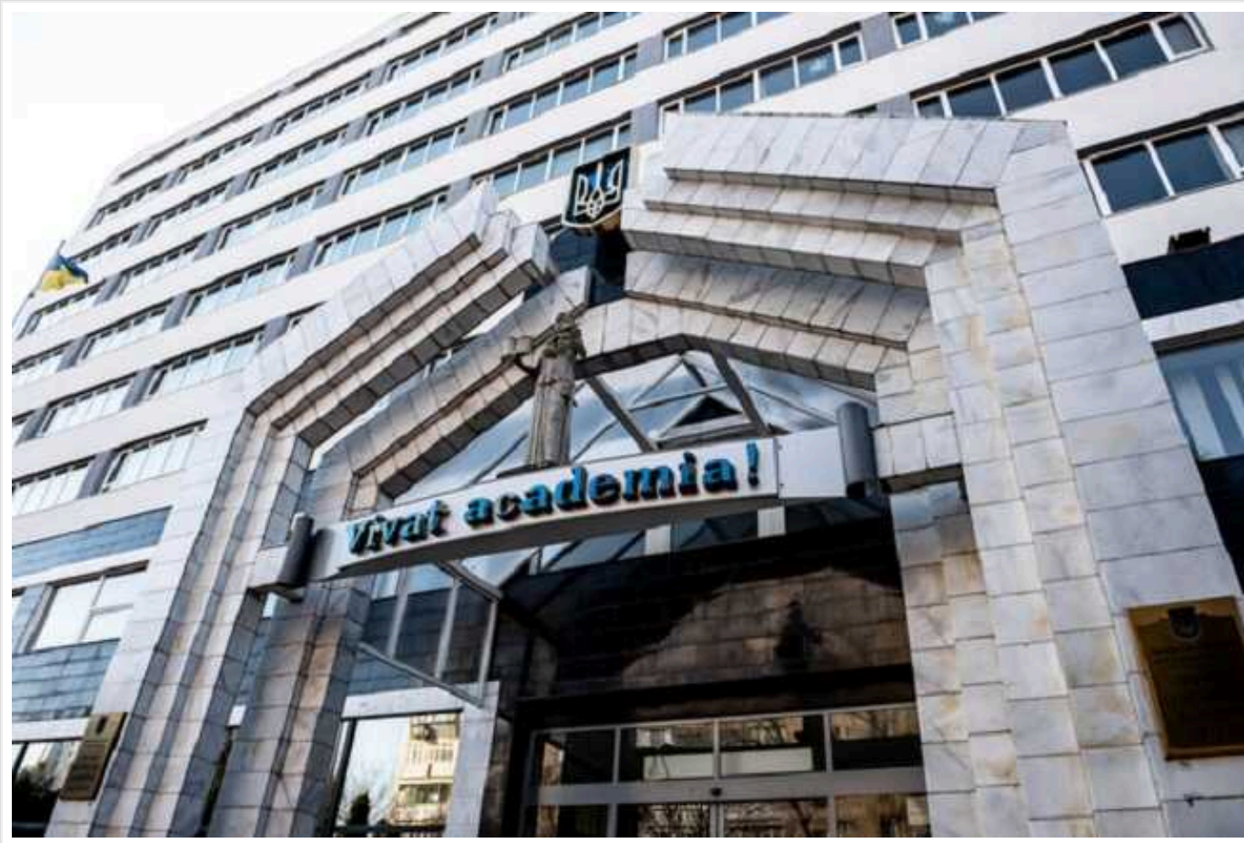
Одеська академія Ківалова передумала купувати кухонне обладнання за 5 мільйонів, щойно АМКУ зніс «заточки»

Національний університет «Одеська юридична академія» 8 березня відмінив тендер по кухонному обладнанню очікуваною вартістю 4,74 млн грн. Перед тим він за рішеннями АМКУ прибрав дискримінаційні вимоги.