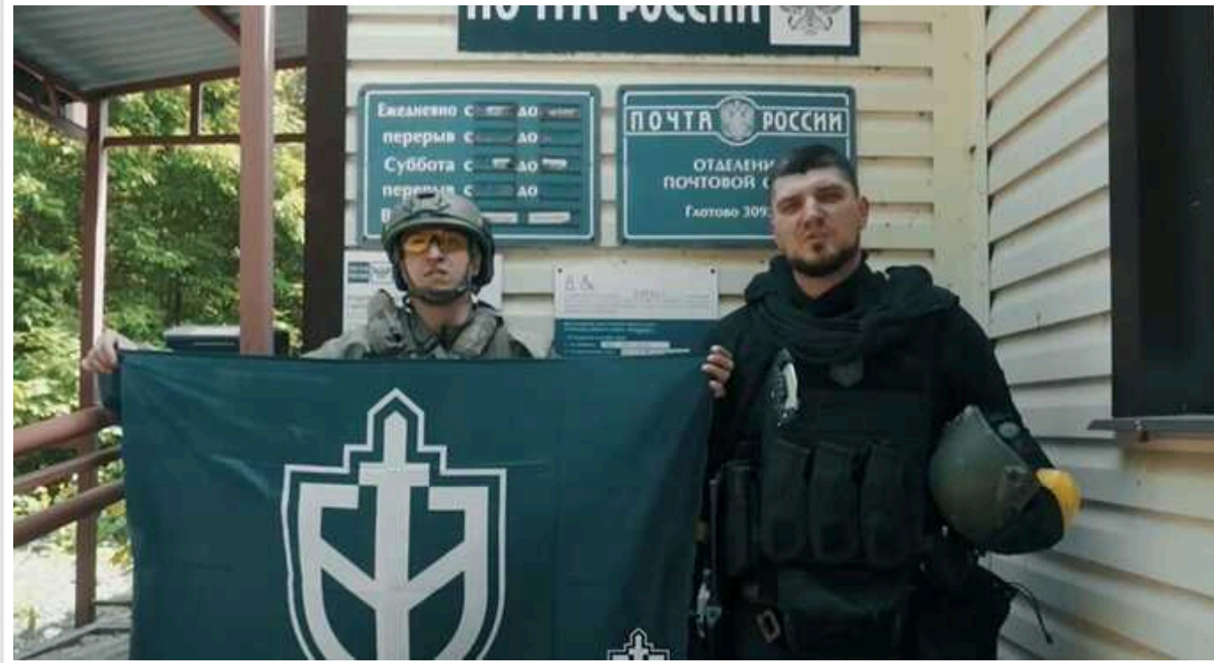
У РДК показали, як танк армії РФ рівняє з землею будинки росіян у селі Козинка

Рейд російських повстанців з "Російського добровольчого корпусу", "Легіону свободи Росії" та "Сибірського батальйону" у Курській та Белгородській областях продовжується. Інформація про придушення операції не відповідає дійсності.