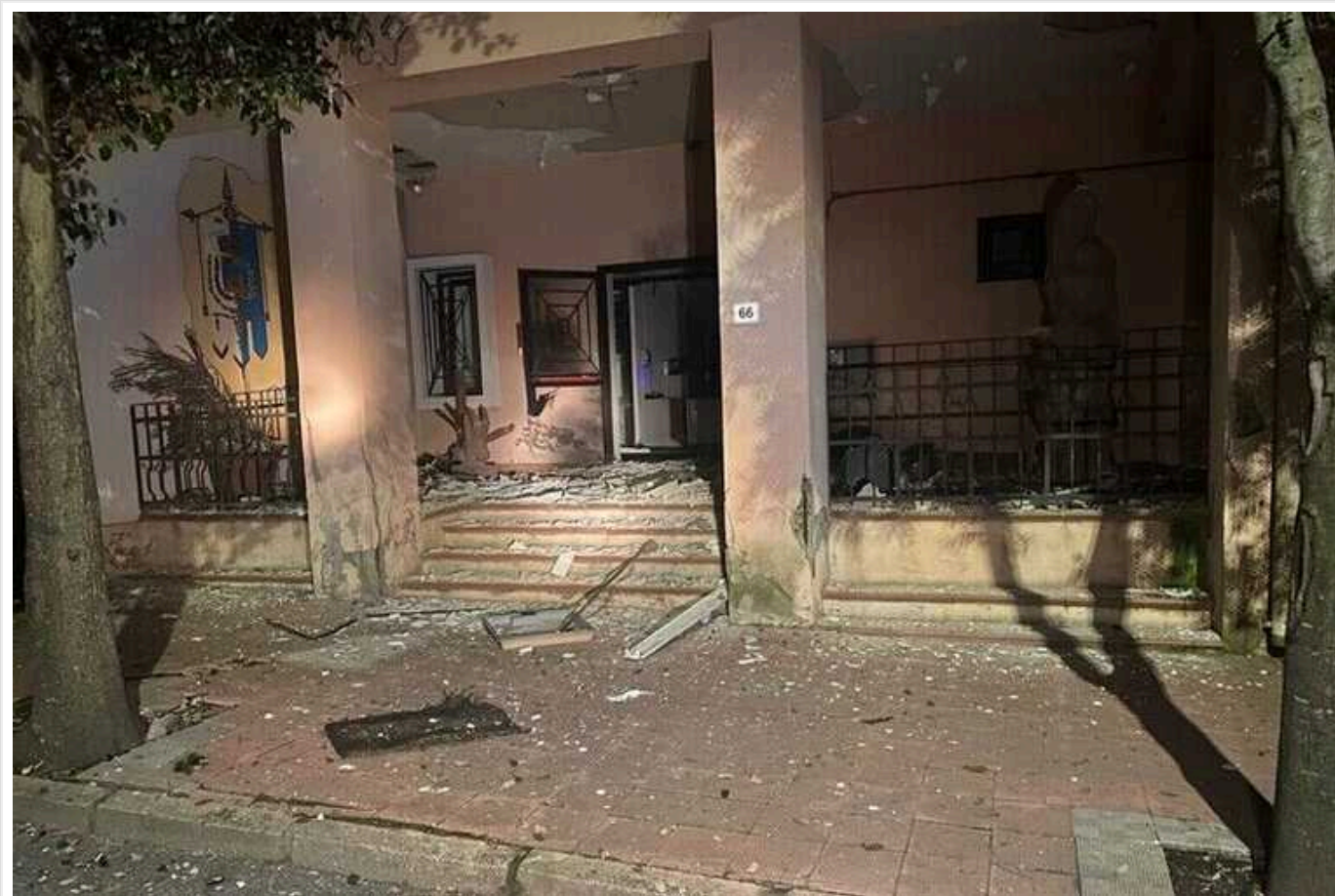
На Сардинії стався вибух біля мерії: поліція розслідує акт залякування

На Сардинії у п'ятницю ввечері перед входом до мерії Оттани в районі Нуоро стався потужний вибух. Поліція розслідує "акт залякування".