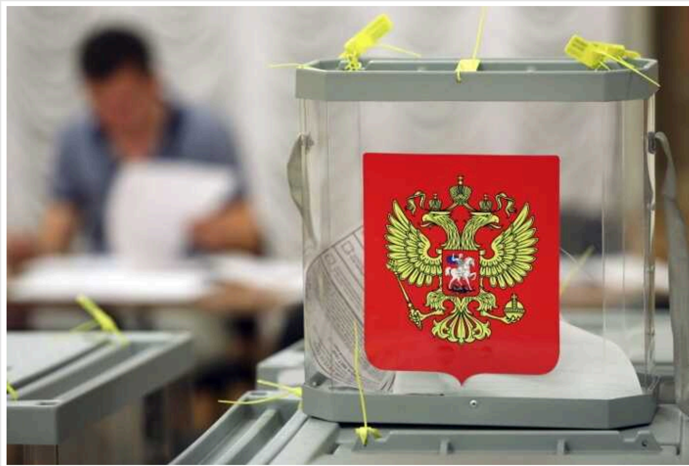
У Росії жителів Уралу приписали до "виборчих дільниць" на окупованих територіях України

У Свердловській області Росії деяких громадян із правом голосу без їхнього відома "перекинули" для голосування на дільниці тимчасово окупованих населених пунктів Запорізької й Донецької областей України. На такі випадки поскаржилися жителі російських міст Артемівський та Єкатеринбург.