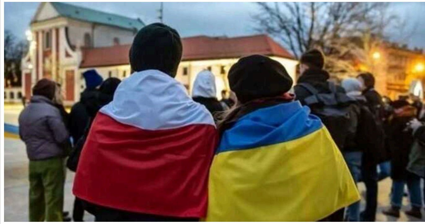
Українські підприємці перерахували до бюджету Польщі понад 5 мільярдів злотих

Упродовж 2023 року українці в Польщі сплатили до бюджету країни податків на понад 5 млрд злотих.