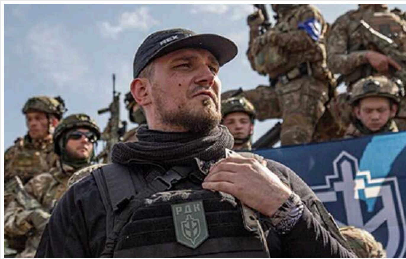
У РДК викрили брехню МО РФ і покликали губернатора Белгородської області "на зустріч"

Російські добровольці з "Російського добровольчого корпусу" висміяли заяву міноборони РФ про "1,5 тисячі втрат терористів", з яких близько 500 осіб нібито було вбито російськими військовослужбовцями. На брехню про повне знищення практично всього складу РДК там відреагували публікацією відео із захопленими в полон на території РФ російськими військовослужбовцями.