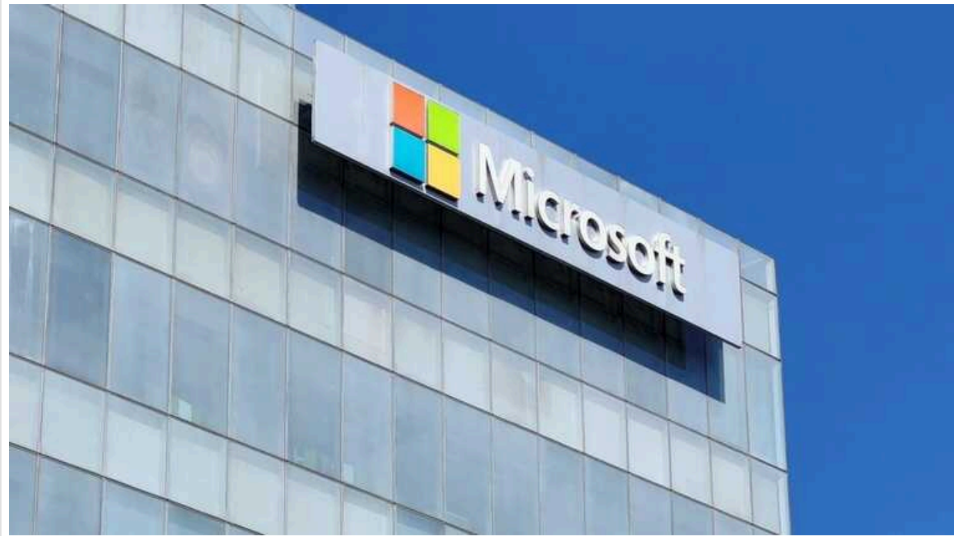
Microsoft і Amazon закриють доступ до своїх хмарних сервісів у Росії

Обмеження пояснюються 12-м пакетом санкцій ЄС проти Росії, куди входить і програмне забезпечення для бізнес-аналітики.