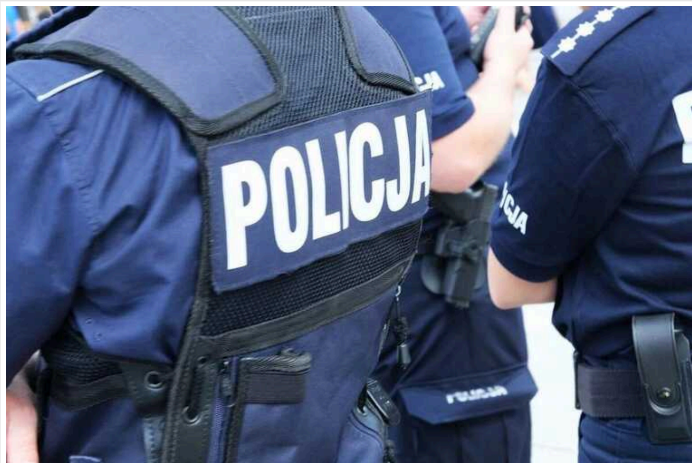
У центрі Варшави обстріляли із пневматичної зброї 5 автобусів

Сьогодні, 16 березня, до поліції надійшло повідомлення про постріли з пневматичної зброї по п'ятьох автобусах, що йдуть вулицею Marszałkowskiej . Усередині були пасажирів, ніхто не постраждав. 🇺🇦🇺🇦🇺🇦🇺🇦