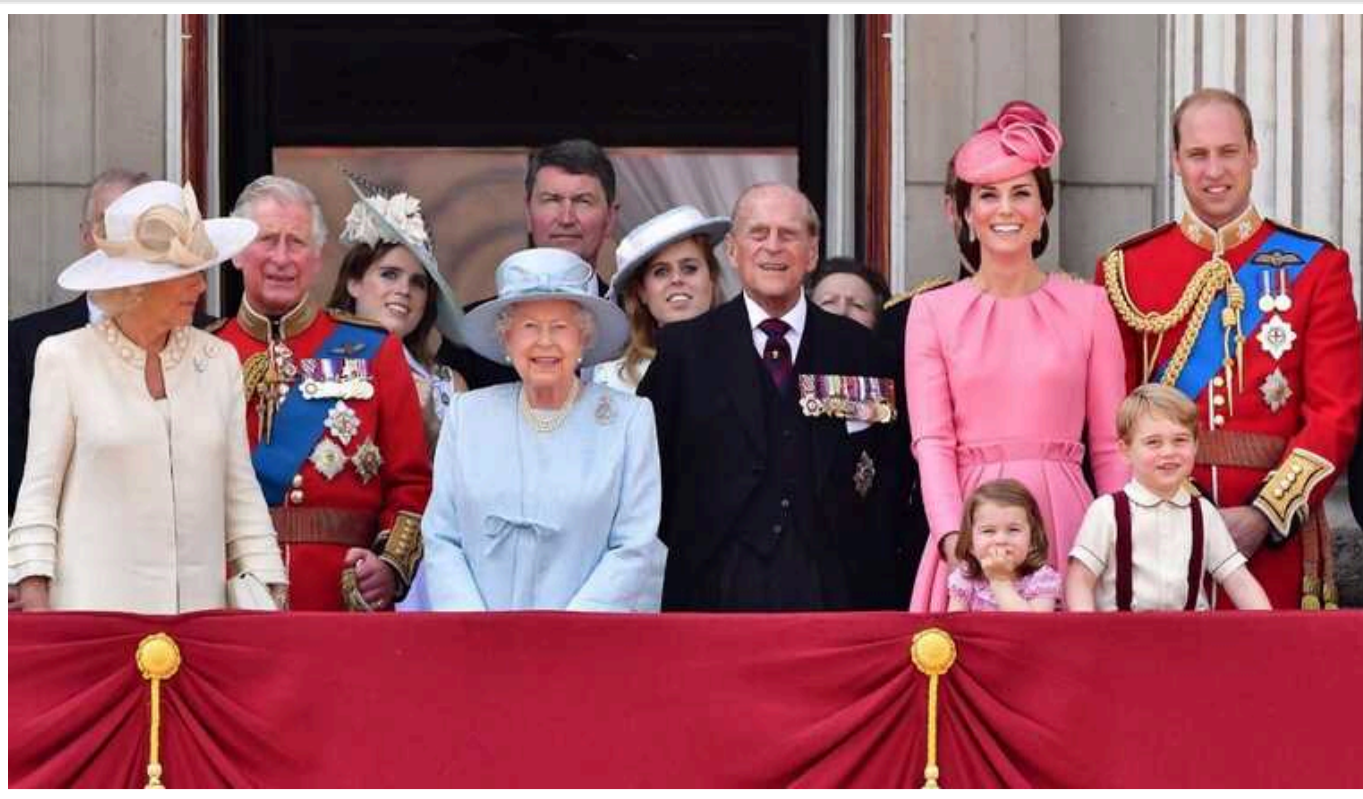
У ЗМІ розповіли, за що перепрошували члени королівських сімей

Найневзначайніші вибачення принесли Король Віллем-Олександр та королева Нідерландів Максима. Ін довелися визнати на публіку, що вони порушили соціальну дистанцію під час пандемії коронавірусу.