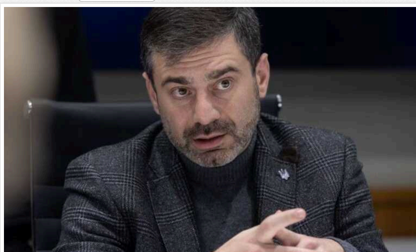
Лубінець розповів, як РФ використовує тему обміну полоненими: "Ворог почав масово телефонувати"

Російські окупанти почали телефонувати рідним військовополонених і брехати, що Україна нібито "не хоче забирати" своїх громадян із неволі. Ворог підбурює українців влаштовувати протести та блокувати адмінбудівлі, домагаючись дестабілізації ситуації в Україні.