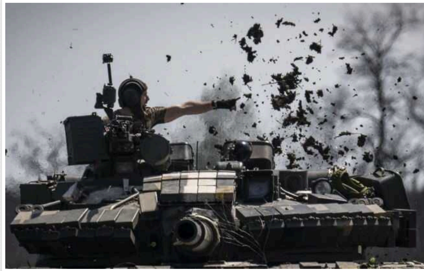
Окупанти на захоплених територіях агітують українців укладати контракт зі ЗС РФ, – ЦНС

На тимчасово окупованих територіях російська сторона здійснює набір українців для участі у війні проти своєї Батьківщини. Зокрема, на Сході України та в Криму росіяни агітують чоловіків вступати до складу Збройних сил Російської Федерації та укладати контракти.