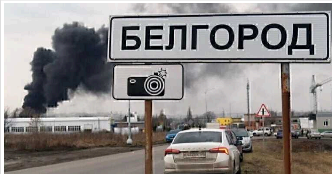
У Білгородській області призупинять роботу навчальних закладів та ТЦ через обстріли

У Білгородській області та Білгороді призупинять роботу торгових центрів, шкіл та коледжів через обстріл.