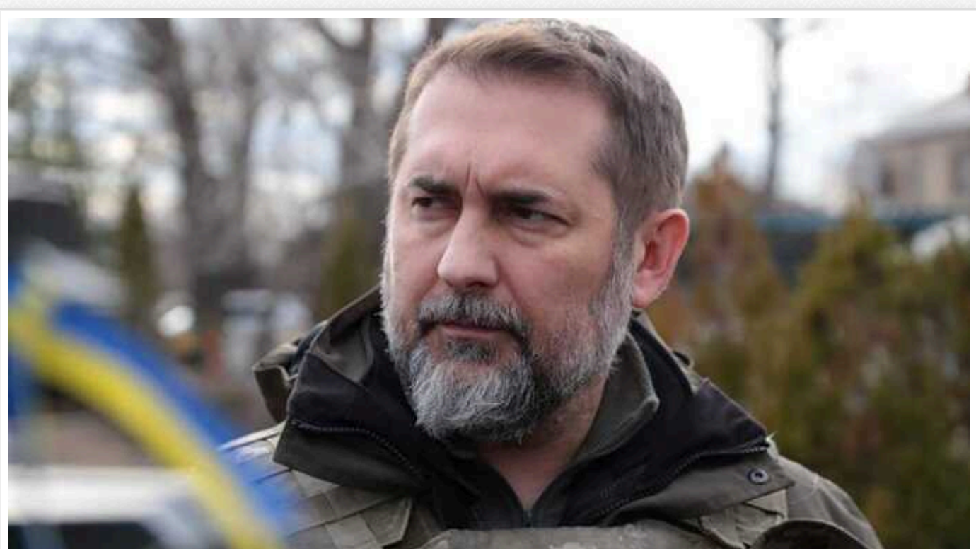
Колишній голова Луганської ВЦА розповів про ситуацію на окупованій Луганщині

На Росії готуються до так званих виборів Путіна 17 березня. Російські окупанти всіляко намагаються одержати і голоси жителів окупованих українських територій – когось заохочують взяти участь у цих псевдовиборах, а до когось приходять військові, і люди змушені голосувати фактично під дулом автомата. Разом з тим, пропагандисти, які приїжджають у захоплені і фактично знищені росіянами міста – жахаються від побаченого.