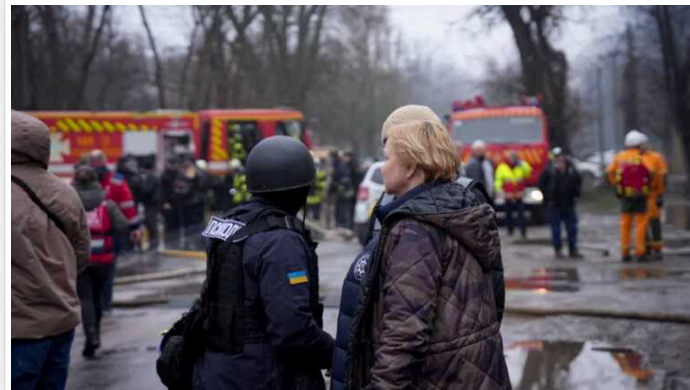
З'явилися нові дані про стан постраждалих унаслідок удару окупантів по Одесі: десятки людей у лікарнях

Загальна кількість жертв російського теракту в Одесі склала більше 75 людей. З них 40 людей після ракетного удару перебувають на лікуванні у медичних закладах.