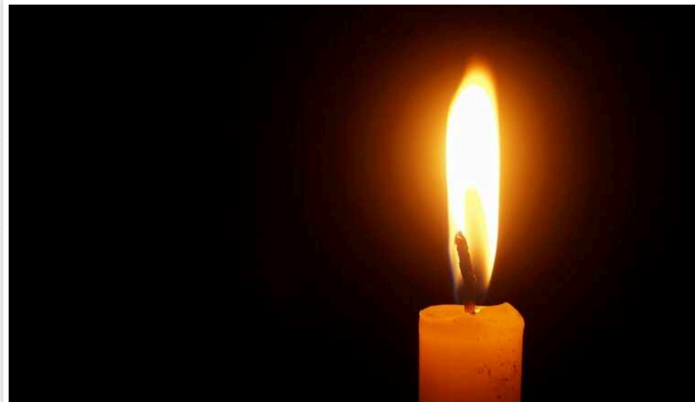
Під час вчорашнього удару по Одесі загинув ще один поліцейський