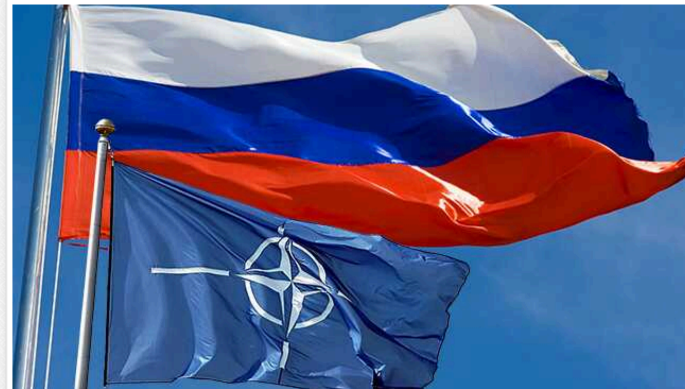
Німеччина отримала дані про можливість нападу Росії на НАТО з 2026 року, – Business Insider

Німецькі спецслужби підготували для уряду аналіз військової загрози з боку Росії, який прогнозує, що "з 2026 року" вона може напасти на територію країн-членів Північноатлантичного альянсу.