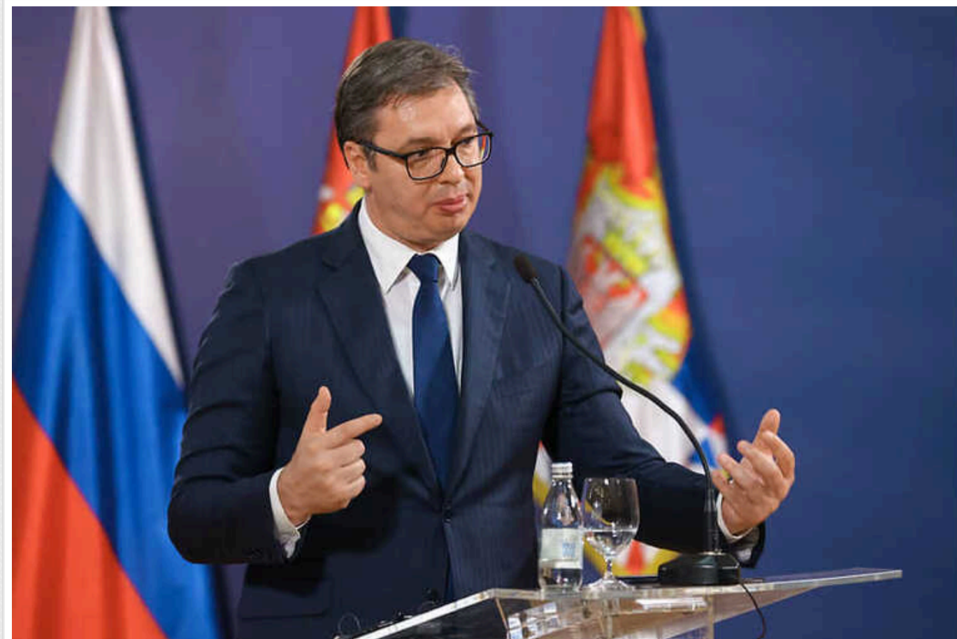
Президент Сербії назвав два сценарії війни в Україні: Конфлікт РФ із Заходом чи «перемир'я»

Президент Сербії Александар Вучич заявив, що Захід повинен найближчим часом змінити підхід до повномасштабного вторгнення Росії в Україну, аби запобігти масштабнішому конфлікту.