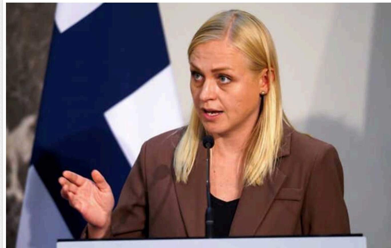
Захід не повинен виключати введення військ в Україну, – голова МЗС Фінляндії

Міністерка закордонних справ Фінляндії Еліна Валтонен вважає, що західні країни, зокрема й США, не повинні бути повністю проти ідеї введення військ в Україну, якщо ситуація там погіршиться.