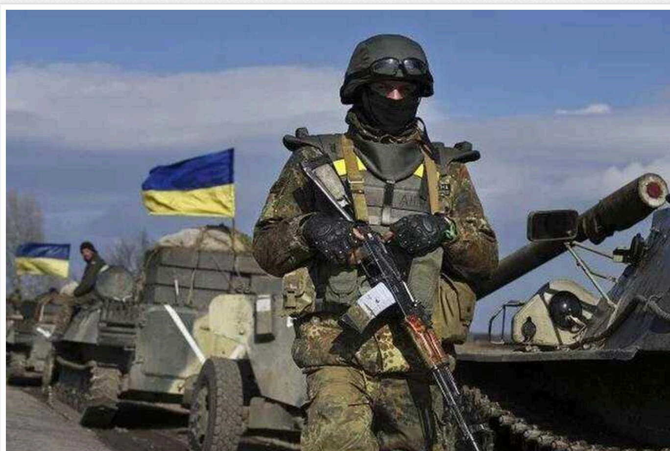
Ситуація на фронті: відбулося близько 80 бойових зіткнень

За минулу добу на фронті між Силами оборони і росіянами відбулося 78 бойових зіткнень, найбільше – на Авдіївському напрямку.