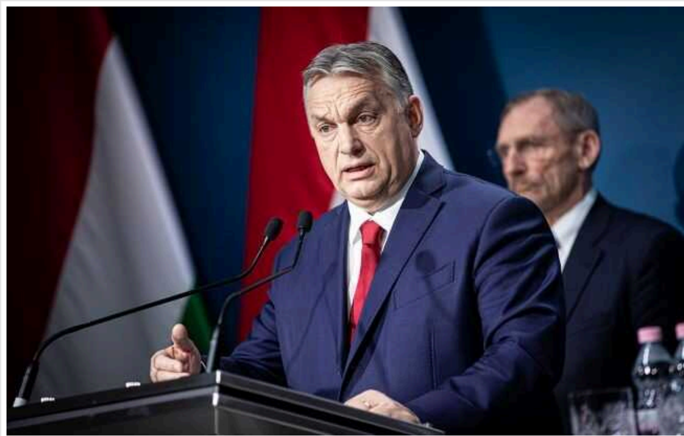
Угорщина розіслала країнам-членам ЄС документ із претензіями до України щодо нацменшин

Угорщина розіслала іншим країнам-членам Євросоюзу документ із претензіями до України щодо угорської національної меншини в країні. Будапешт вимагає відновлення прав на вільне використання угорської мови та політичне представництво на всіх рівнях, зокрема у Верховній Раді.