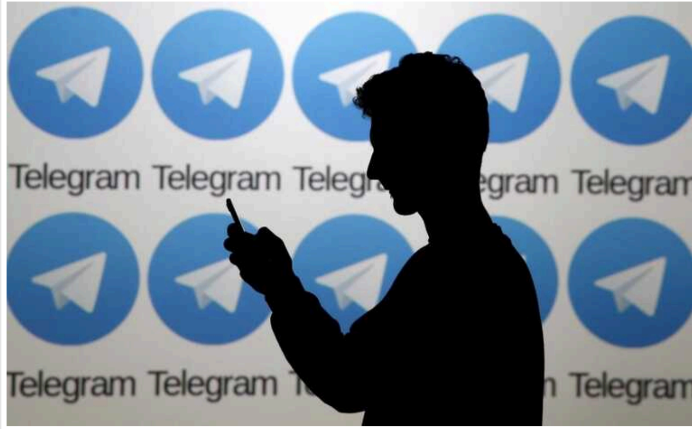
Питання блокування Telegram зараз не стоїть, – Андрій Коваленко

Керівник ЦПД при РНБО Андрій Коваленко у коментарі Forbes заявив, що питання блокування Telegram зараз не стоїть.