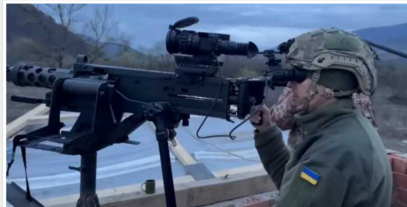
Новий тепловізор українського виробника Archer допоможе краще збивати "Шахеди"

Тепловізійний приціл допомагає краще керувати кулеметом під час полювання на дрони. Його застосування покращить роботу мобільних зенітних груп.