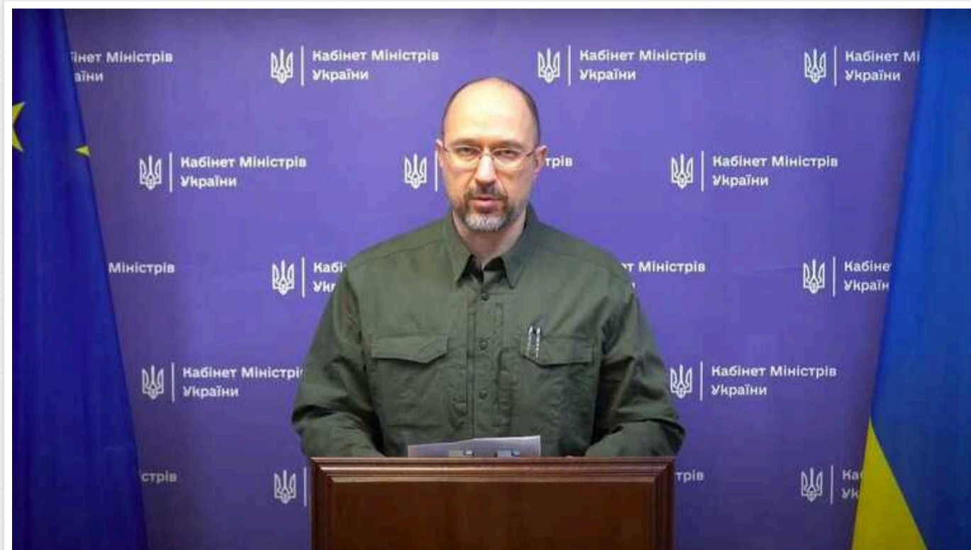
Без допомоги ніяк: витрати рекордно перевищили прибуток бюджету, – Шмигаль

За словами глави уряду, витрати перевищили прибутки більш ніж на 100 мільярдів гривень. Шмигаль заявив, що Україна потребує фінансової підтримки міжнародних партнерів.