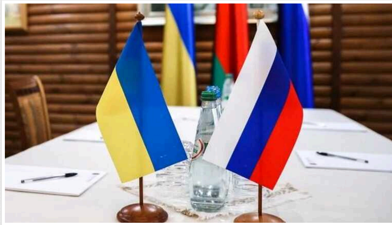
Китай готовий влаштувати мирні переговори між Україною та РФ

Китай погодився, що Україна має право на територіальну цілісність. Також задав про якусь іншу країну, яка "стурбована" власною безпекою.