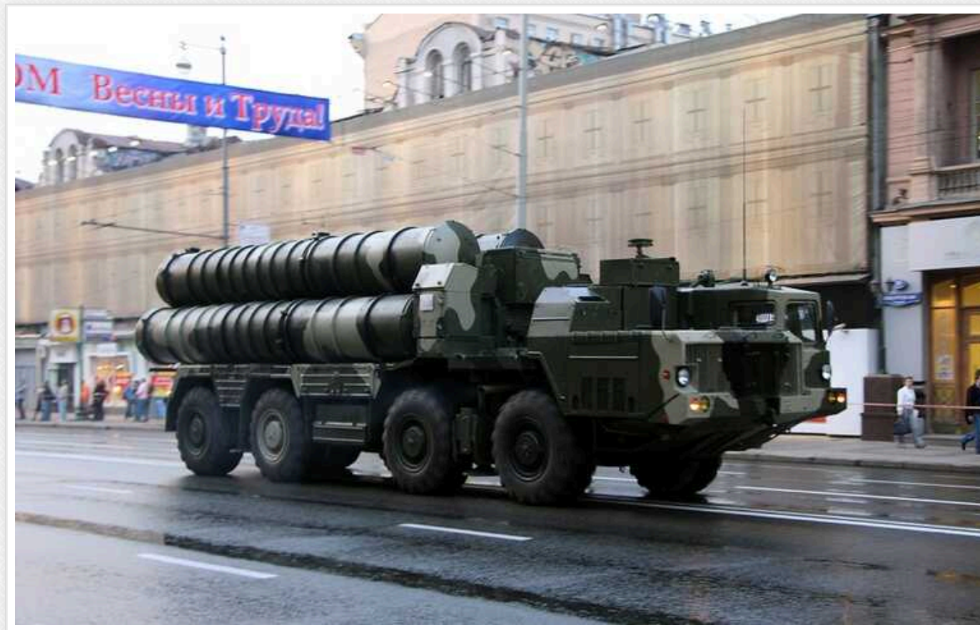
Греція розглядає передачу Україні систем С-300, - ЗМІ

Греція припускає передачу Україні своїх систем ППО С-300, особливо після ракетного удару РФ по Одесі під час візиту прем'єр-міністра Кіріакоса Міцотакіса.