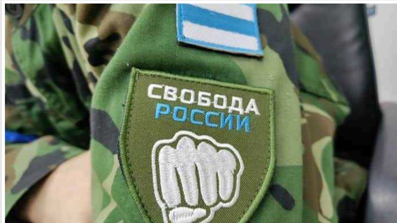
Кремль бреше про явку у Білгородській області, ділянки обстрілюються, - Легіон "Свобода Росії"

Повідомлення російських офіційних ресурсів про те, що станом на 15:00 у Білгородській області на так званих президентських виборах проголосувало вже понад 50% виборців, не відповідають дійсності, бо область обстрілюється з боку російських добровольців, зокрема під вогнем виборчі ділянки.