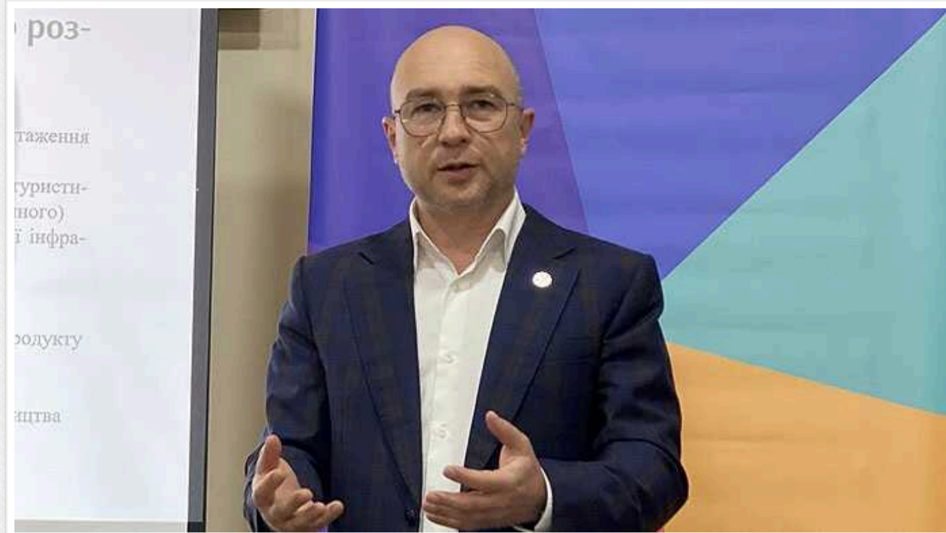
ВАКС випустив ексчиновника Міноборони Лієва, якого підозрюють у розкраданні 1,5 мільярда гривень

Ексчиновника Міноборони Олександра Лієва, якого підозрюють у розкраданні 1,5 мільярда гривень Вищий антикорупційний суд випустив під особисте зобов'язання (тобто на волю зі СІЗО). Трансляція рішення була призупинена.