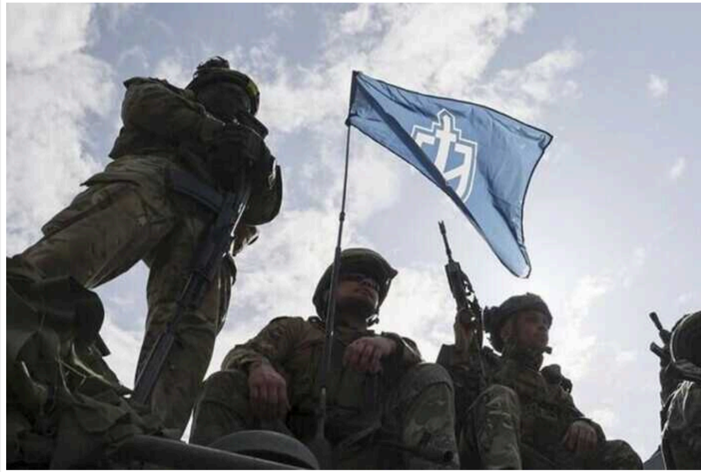
Політолог розповів, як Путін намагається використати рейд російських добровольців у своїх інтересах

Російський політолог Іван Преображенський в інтерв'ю Radio NV пояснив, як диктатор Володимир Путін намагається використати рейд російських добровольців на територію РФ.