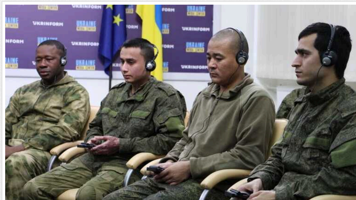
Росія шукає найманців по всьому світу: у полон ЗСУ потрапили громадяни Непалу, Куби, Сьєрра-Леоне та Сомалі

У Росії закінчується мобілізаційний ресурс, тому вона шукає найманців по всьому світу, зокрема в південних країнах з важкою економічною ситуацією. Наразі в українському полоні перебувають громадяни Непалу, Куби, Сьєрра-Леоне та Сомалі.