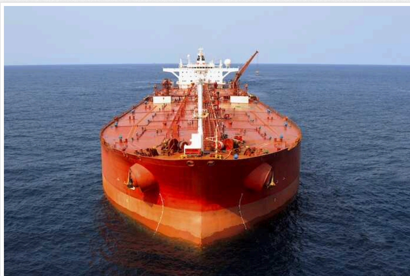
Нафту з Росії возить "тіньовий флот" танкерів без нормального страхування, - FT

Багато російських танкерів з "тіньового флоту", який возить нафту в обхід санкцій, виявилися фактично не застрахованими на випадок стихійних лих та інших катастроф. Такі судна покладаються на страховку, за якою неможливо отримати виплати. Це загрожує серйозними наслідками через розливи нафти, адже завчасий очищення вод оплачується саме за рахунок страхової.