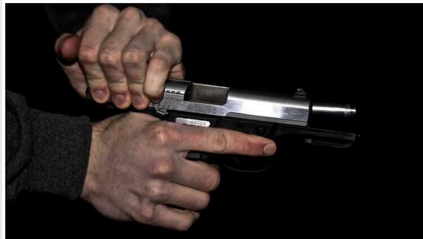
У столиці чоловік кілька разів вистрілив у бік перехожого

У Києві затримали чоловіка, який під час конфлікту з перехожим кілька разів вистрілив у його бік. Як виявилось, зловмисник був п'яним.