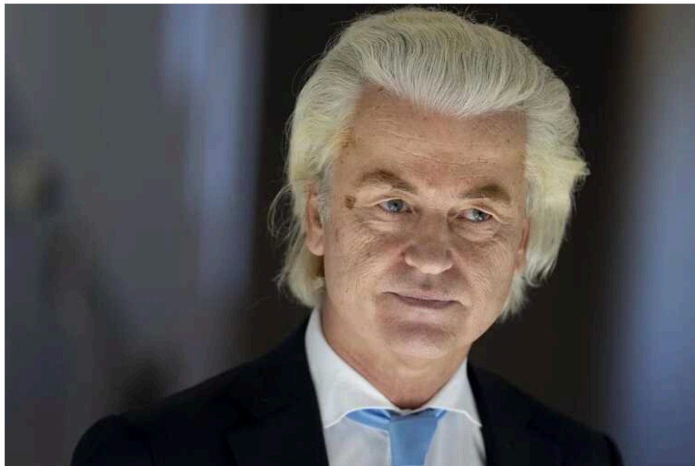
Антиукраїнський популіст Вілдерс "пролетів" із посадою прем'єра Нідерландів: як Західна Європа усвідомлює, що краще бути на боці України

Важливі для України політичні процеси відбуваються в парламенті Нідерландів – країни, яка має стати провідним постачальником літаків F-16 для ЗСУ та увесь час надавала максимальну військову допомогу в межах своїх можливостей.