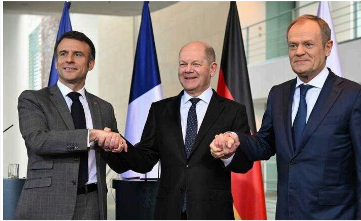
Допомога для України має бути негайною та максимально інтенсивною, – Туск

У п'ятницю, 15 березня, в канцелярії Берліна відбулися переговори у форматі Веймарського трикутника за участю прем'єр-міністра Дональда Туска, канцлера Німеччини Олафа Шольца та президента Франції Еммануеля Макрона. Лідери країн погодилися, що допомога для України має бути негайною і якомога більшою, щоб ситуація Україна найближчим часом не погіршилася, а покращилася.