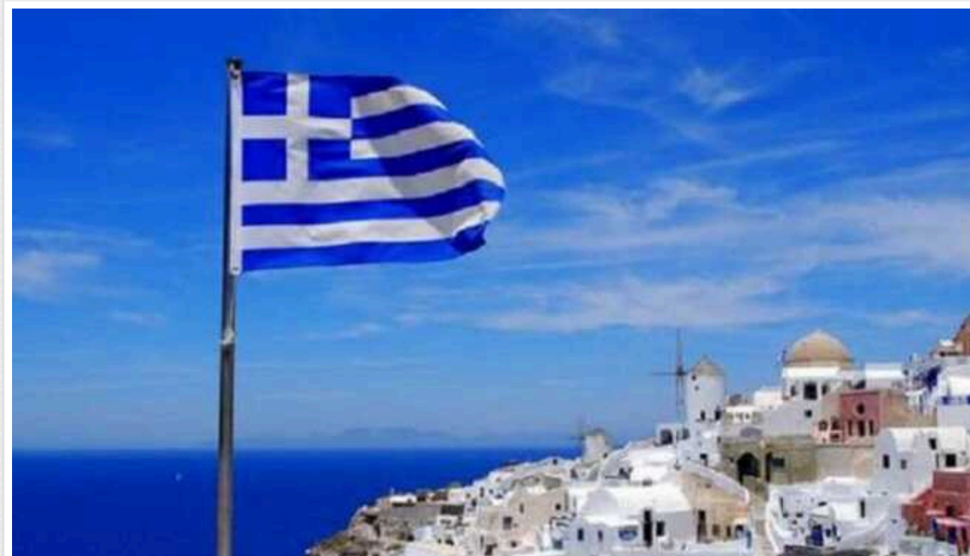
Греція буде постачати Україні зброю та боєприпаси за посередництва Чехії

Греція продовжить постачати Україні зброю і боєприпаси цього року, не вичерпуючи своїх запасів. Обладнання закуповуватимуть із Чехії та передадуть напряму в Україну.