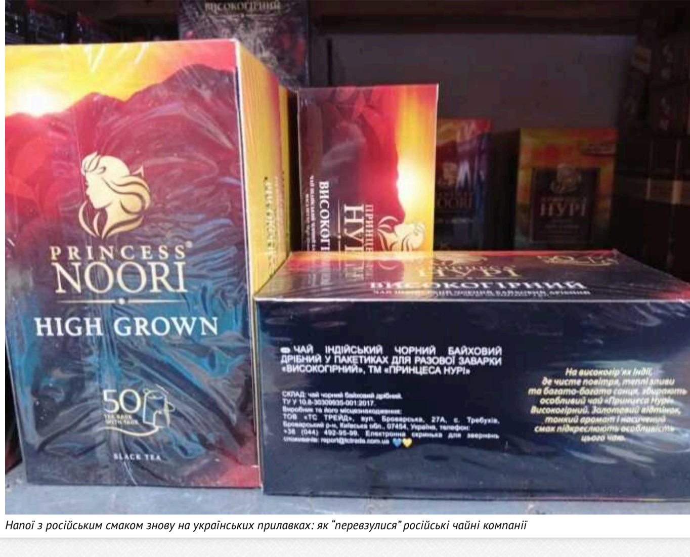
Напіо з російським смаком знову на українських прилавках: як "перевзулися" російські чайні компанії

До 2022 року 40% ринку чаю в Україні займали компанії з російськими кінецьними бенефіціарними власниками: "Орімі Україна" та "Компанія май Україна". Ці назви мало про що சொвять споживачам, але лець не кожен знає бренди, якими ті володіли: Greenfield, TESS, Принцеса Нурі, "Майський" та Curtis.