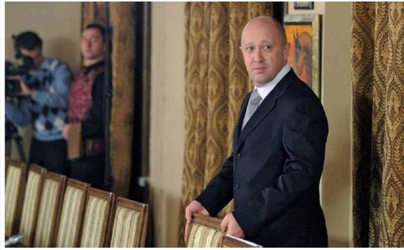
Росіян "потролили" старою заявою Пригожина про ризик втрати Белгорода