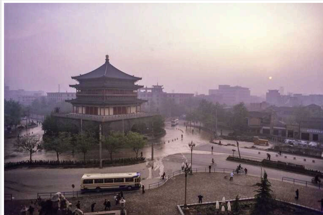
Китай хоче простимулювати свою економіку за рахунок людей з інших країн, - FT

Китай послаблює обмеження на видачу туристичних віз – бажаючи збільшити кількість іноземців, які відвідують країну. З середини березня до принаймні 30 листопада громадяни одразу 6-ти європейських країн зможуть відвідувати Китай з діловою, екскурсійною, транзитною тощо метою на термін до 15 днів без необхідності оформлення візи. Причина ж такої політики країни полягає в намірі простимулювати свою економіку.