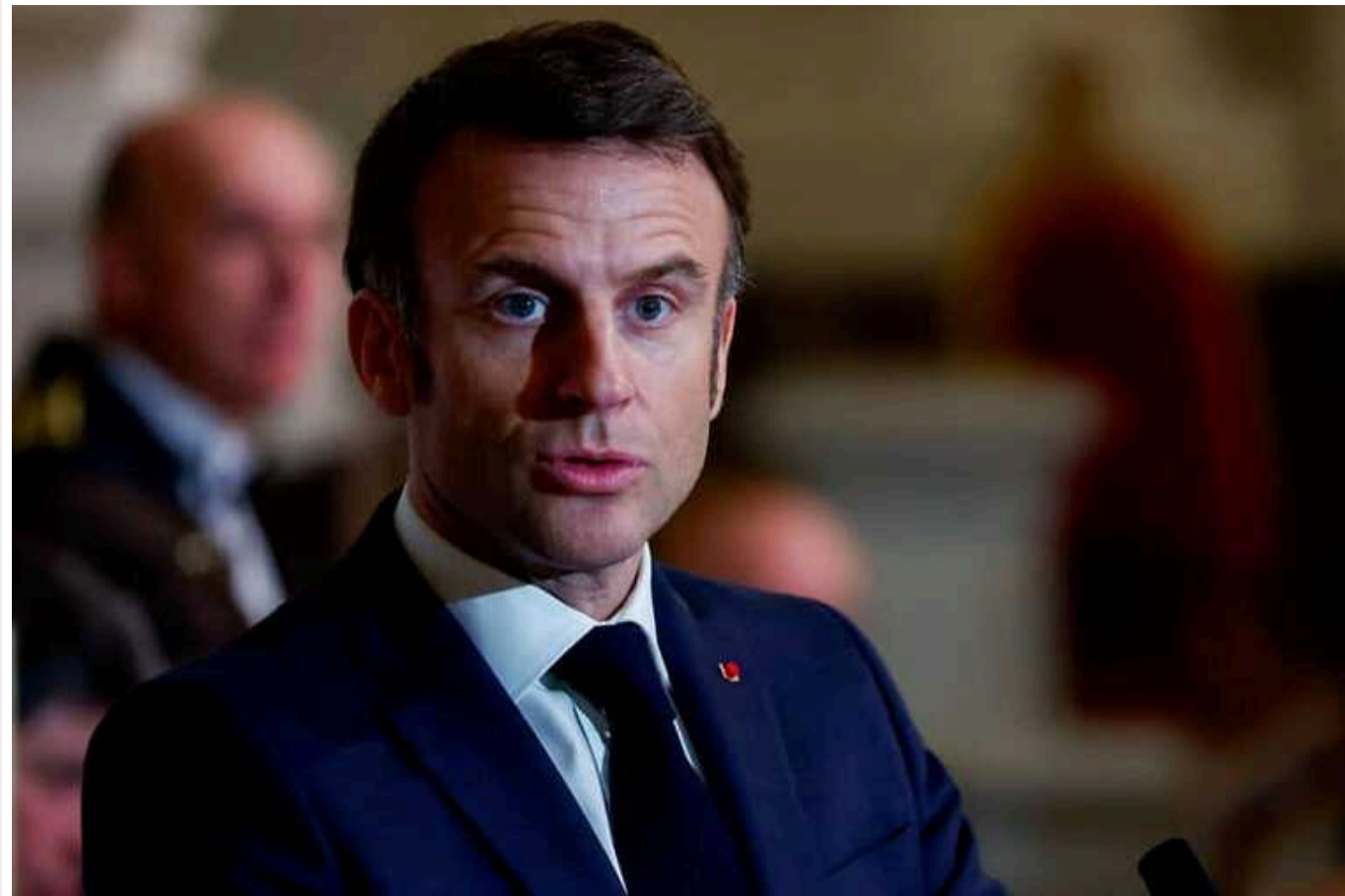
Франція ніколи не виступатиме з ініціативами, які призведуть до ескалації, – Макрон

Президент Франції Еммануель Макрон повідомив, що лідери Веймарського трикутника вирішили уникати ескалації. При цьому він промовчав з приводу своєї позиції щодо можливостей відправки військ в Україну.