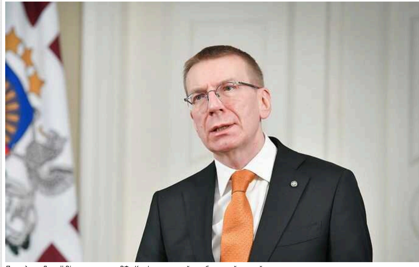
Президент Латвії Рінкевич назвав РФ «Карфагеном, який має бути зруйнований»

Президент Латвії Едгар Рінкевич заявив, що західні країни не повинні проводити червоні лінії для себе.