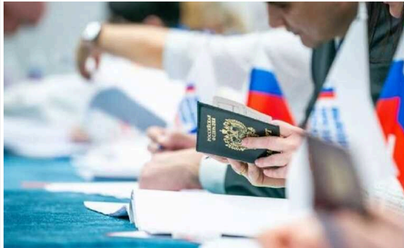
Глава ЦВК РФ висловилася про підпали та інші інциденти на "виборах"

Елла Памфілова заявила, що потрібно залучити Росгвардію для охорони ящиків для голосування, оскільки "подонки за гроші з-за кордону використовують інших покидьків".