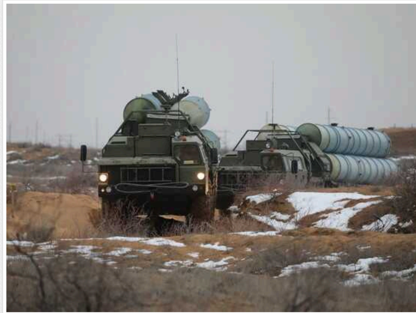
Путін похвалився, що ППО "перехоплює" 90% снарядів і ракет, поки Белгород у вогні

Російський диктатор Володимир Путін стверджує, що сили та засоби протиповітряної оборони Збройних сил РФ нібито знищують 90% ракет та снарядів, що летять на Белгородську та Курську області. Така заява пролунала на тлі численних вибухів у Белгороді, що лунають 15 березня від самого ранку.